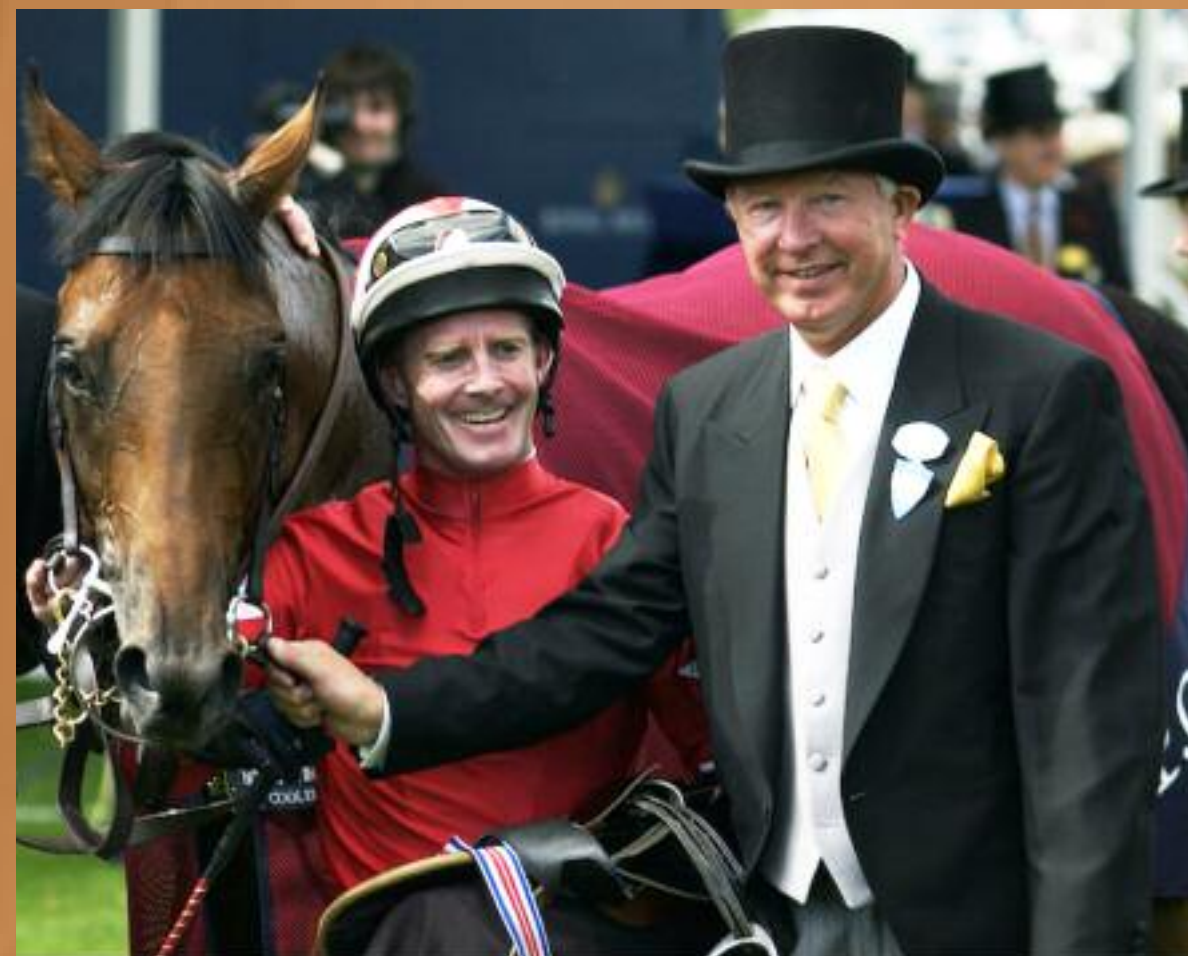
En stolt Sir Alex en en af mange triumfer

Sir Alex Ferguson var manager for Manchester United Football Club. Det var her bl.a. David Beckham spillede inden han gik på pension. Under ledelse af Sir Alex blev Manchester United en af de mest succesrige hold i historien i den engelske Premier League.