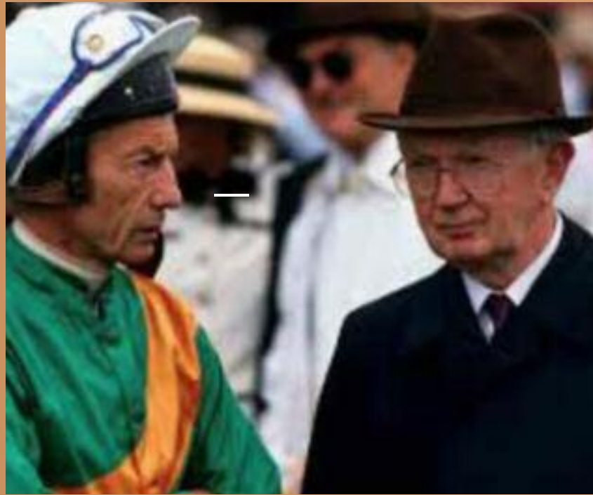
To af Sportens største - Lester Piggott og Vincent O'Brien

Vincent O'Brien, af mange anset som den bedste træner af galoppeste nogensinde døde 1. juni 2009. Et fantastisk menneske!