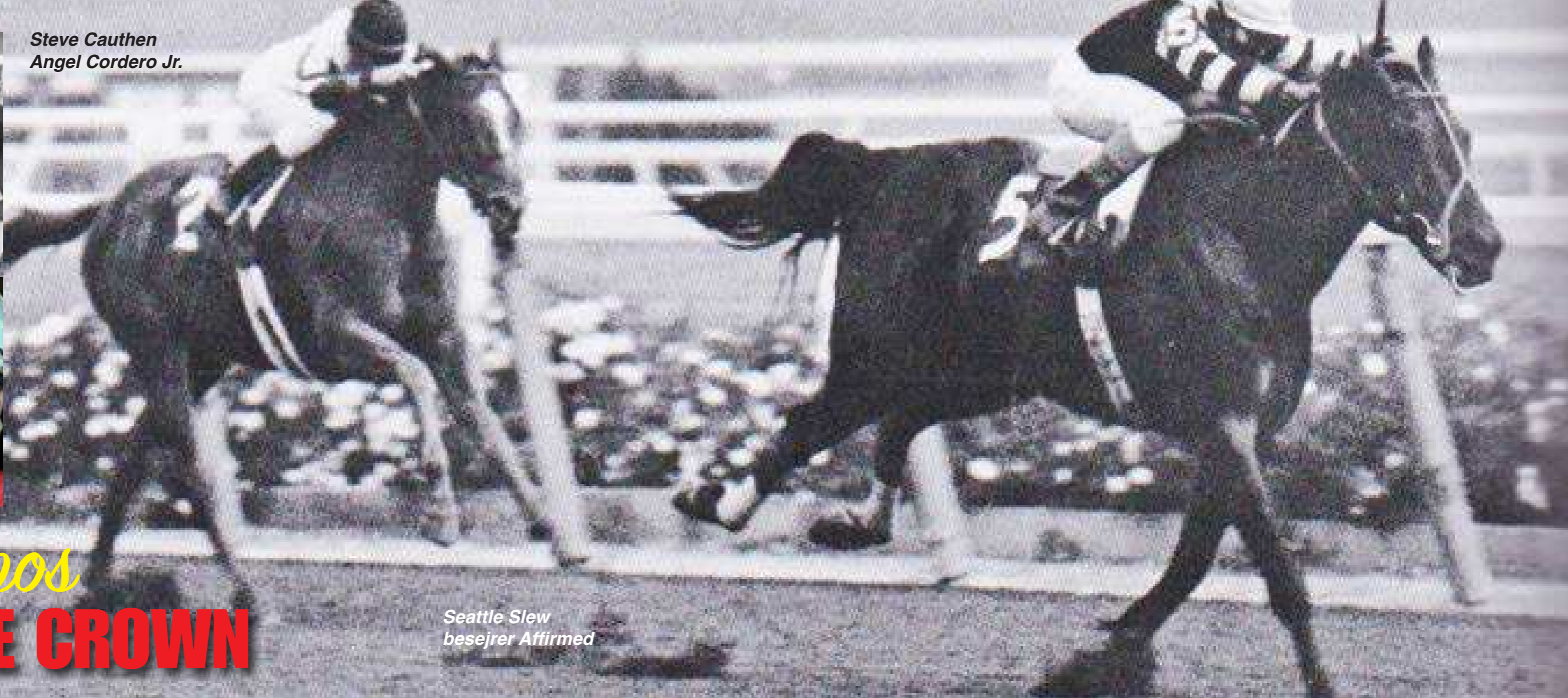
Seattle Slew besejrer Affirmed