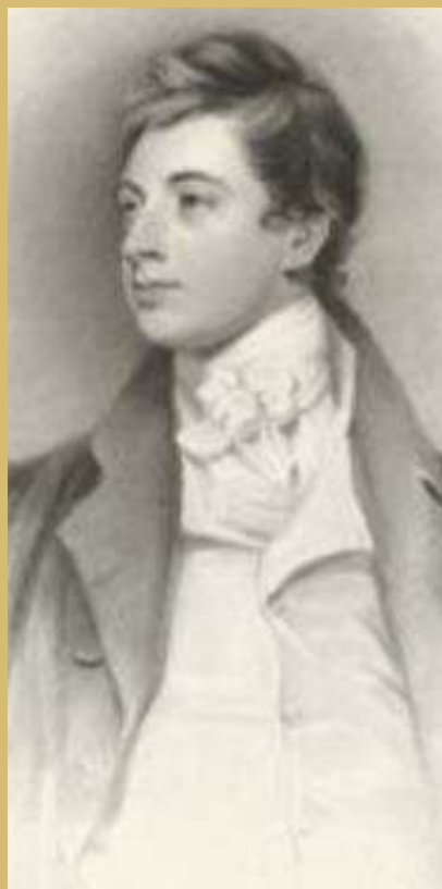
Lord Grafton 2000 Guineas - Ejer