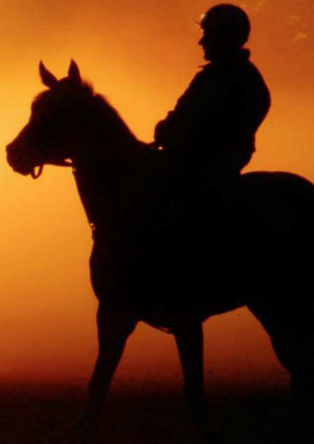
Af: Per Aagaard Bustrup