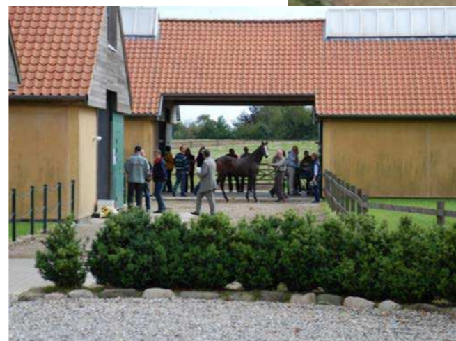
Fremvisning af åringer