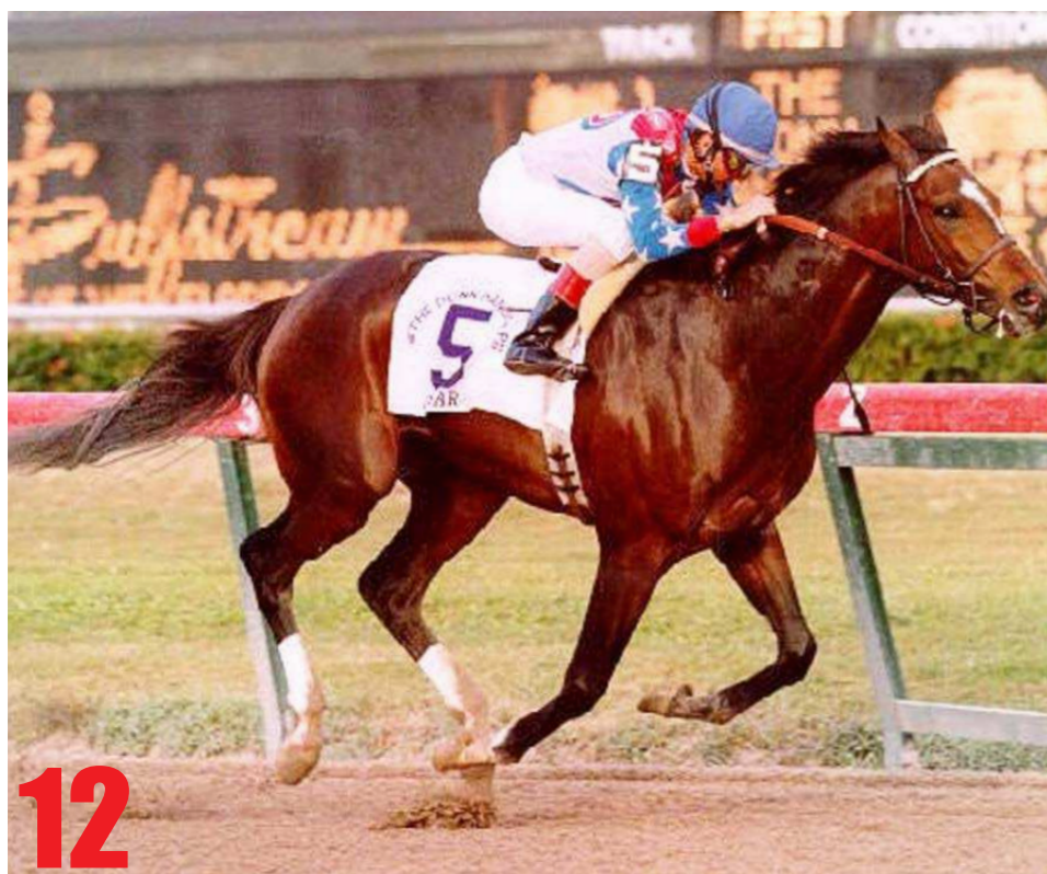
Herunder: Triple Crown-vinder, Secretariat, vandt Arlington Invitational med ni længder