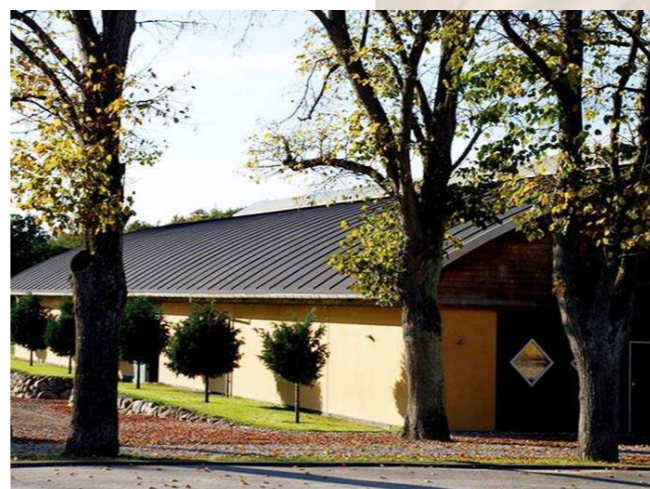
Her afholdes Scandinavian Open Yearling Sale