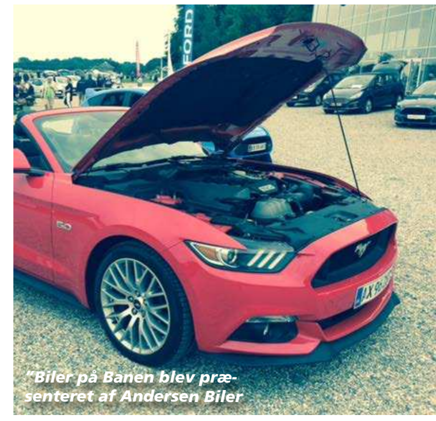
"Biler på Banen blev præsenteret af Andersen Biler