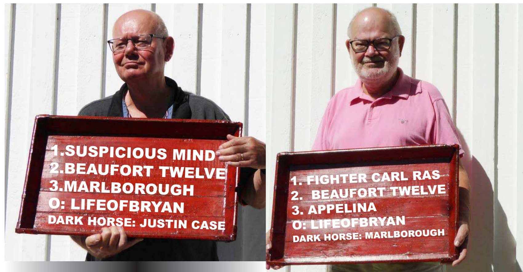
Det klæ'r ham ikke at være så selvsikker