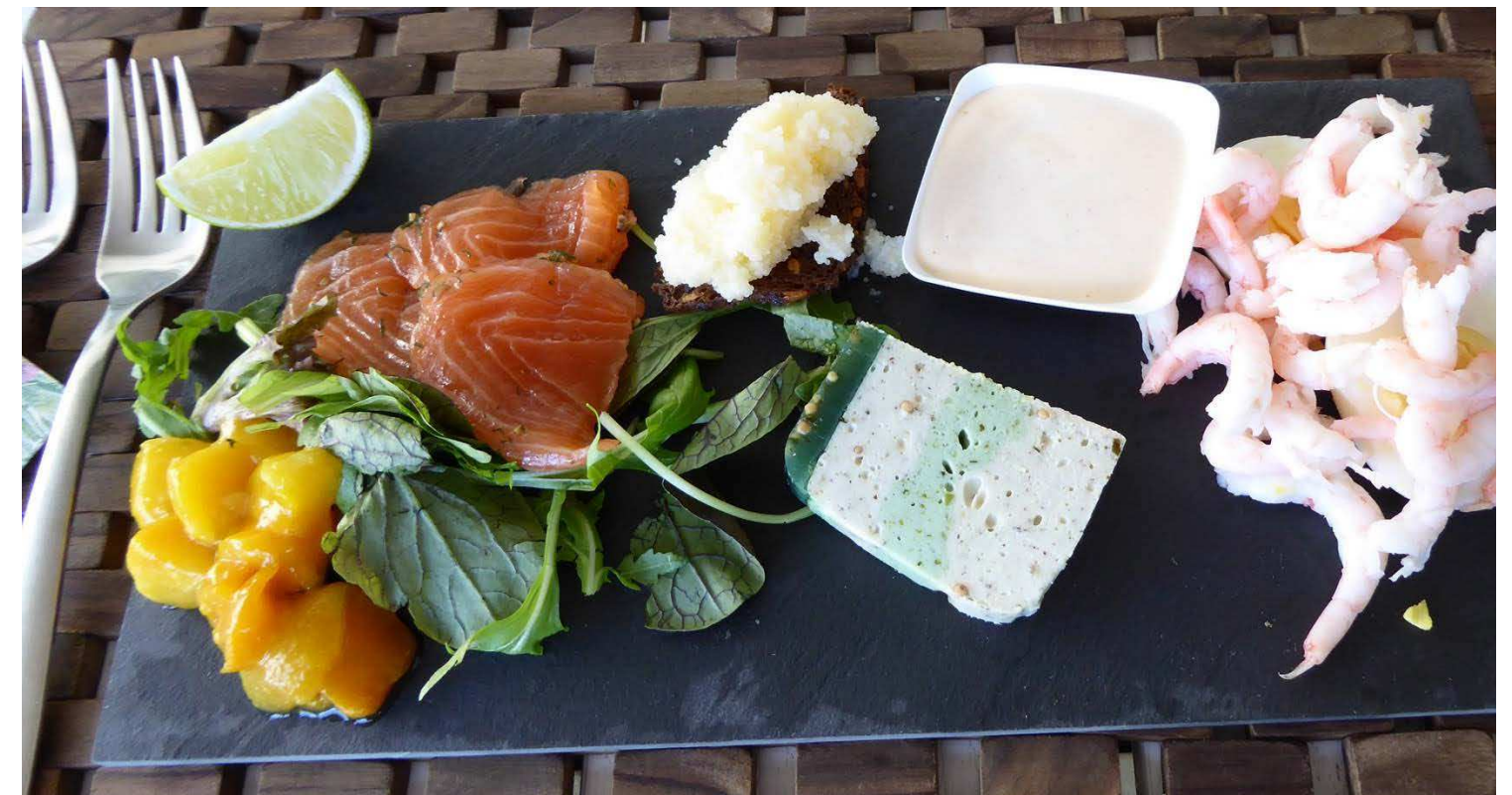
... naturligvis blev der også budt på en herlig frokost