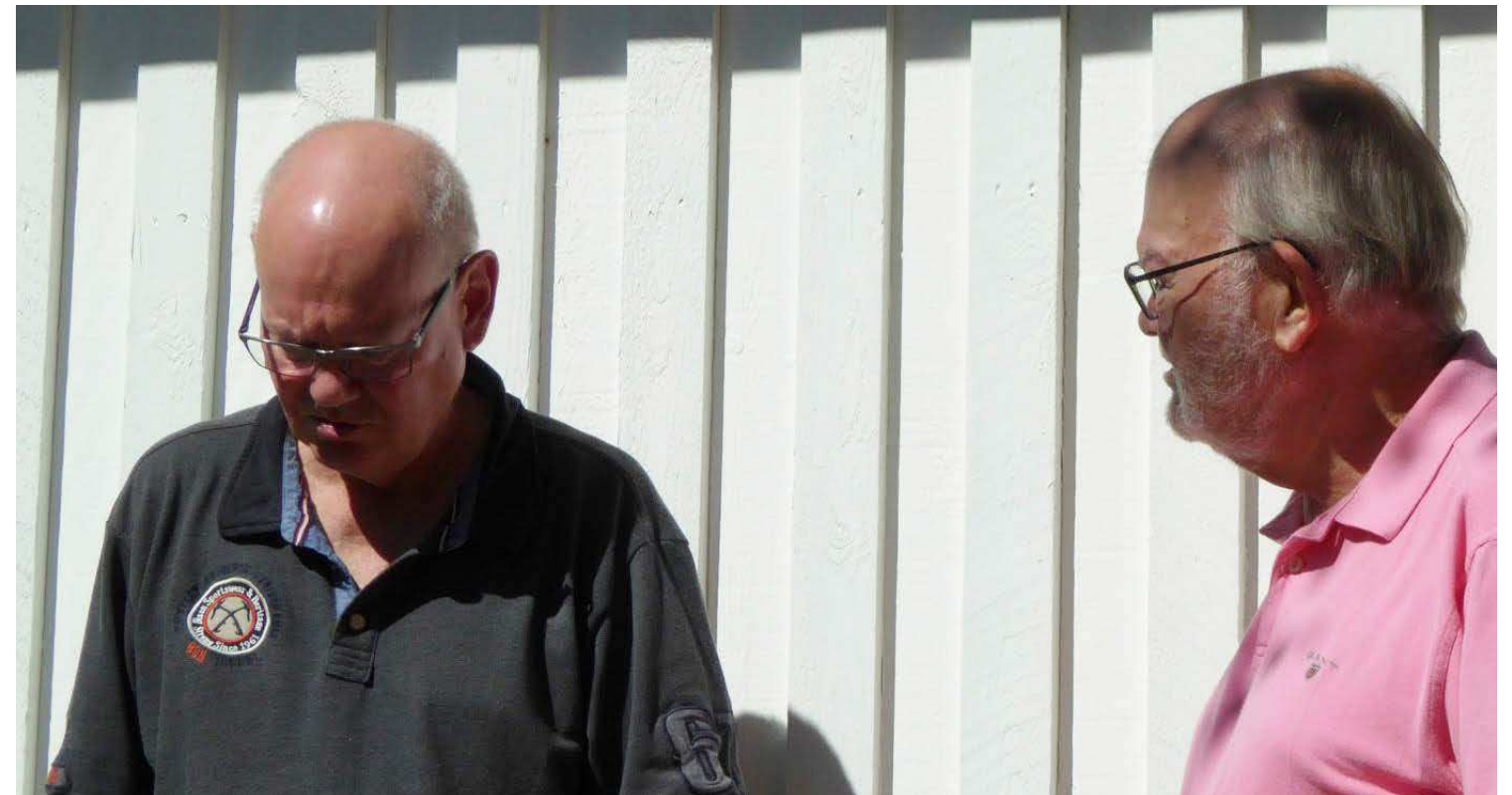
“Fighter Carlras er måske betydeligt bedre, end jeg hidtil har troet.” Per: “det var da også på tide, du begynder at forstå det!”