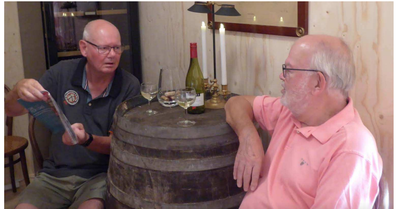
”Succes avler succes” det ved ejerne af Appelina, Stall Perlen, mere end mange andre”