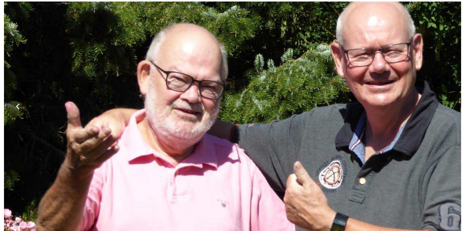
Endelig enige om noget. Beaufort Twelve er en superhest, der givet vil få med udfaldet af Hellerup Finans Dansk Derby at gøre. Det ligger til familien.