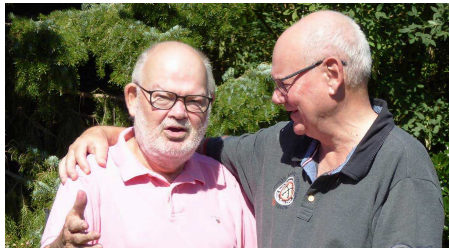
... og det er brødrene mere end enige i!