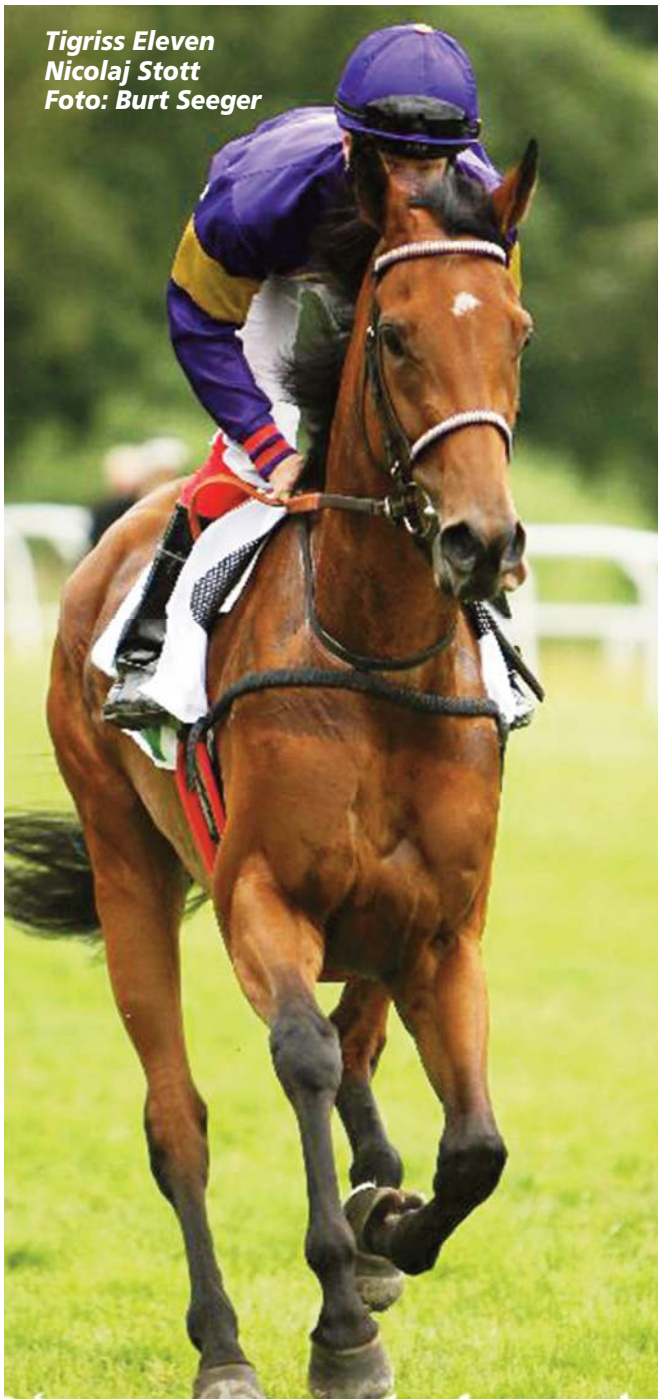
Tigriss Elven Nicolaj Stott

han er sænket otte kg i handicap siden derbyet.