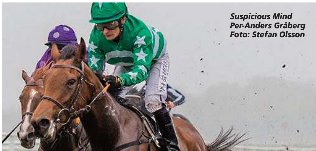
Suspicious Mind Per-Anders Gråberg

Min bedste julehilsen i år var i øvrigt Årsgaloppen 2015. En god fornyelse. Tak for det.