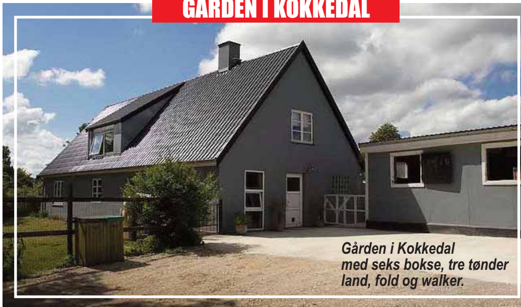
Gården i Kokkedal med seks bokse, tre tønder land, fold og walker.