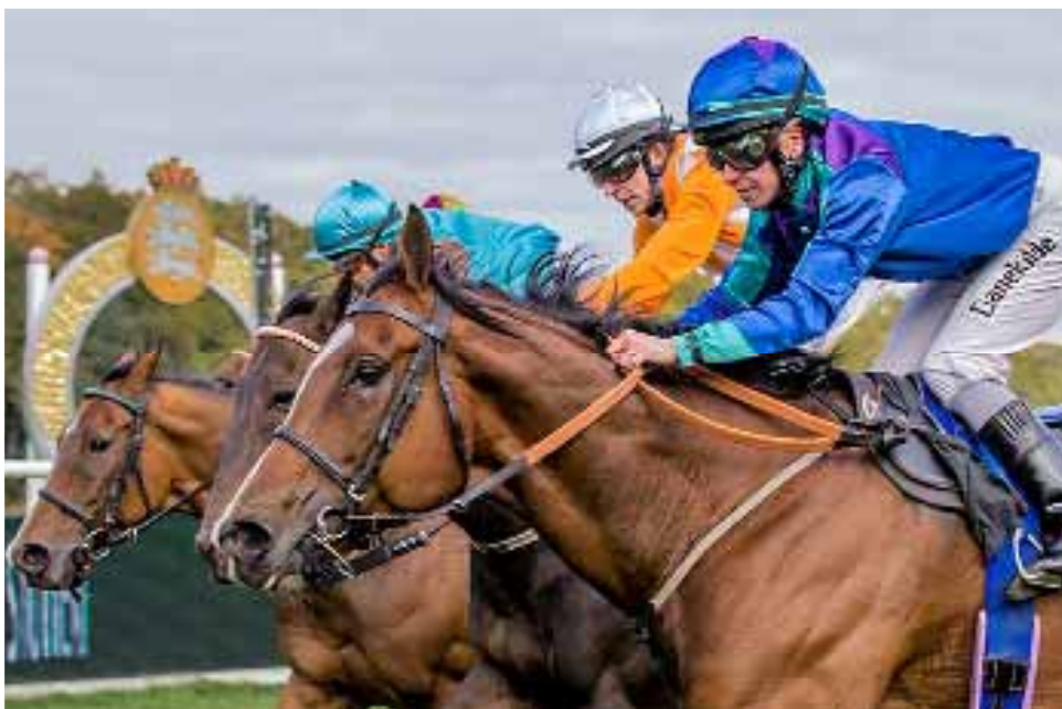
Det meget tætte opløb i Niels Overgård Memorial over 1600 meter 10. oktober endte i et tæt opløb mellem Einsteins Folly, Maltho, The Kicker, Jubilance, Goldstep og Footstepsofspring, hvor der kun var 1,5 længder mellem de seks første.